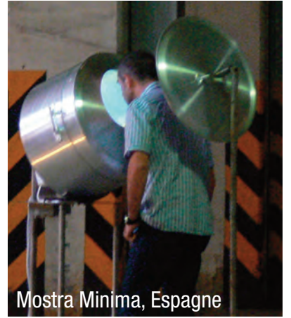
Mostra Minima, Espagne