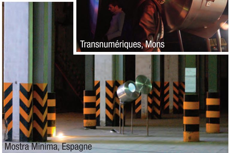
Mostra Minima, Espagne